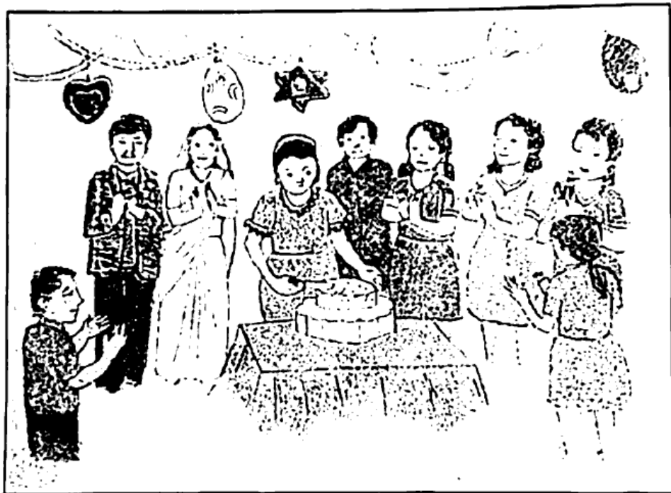
(birthday party, decoration, guests, friends, parents, cake, table, balloons)

(બ) કૌંસમાં આપેલ શબ્દોનો ઉપયોગ કરી આપેલ ચિત્રનું વર્ણન કરો. 4